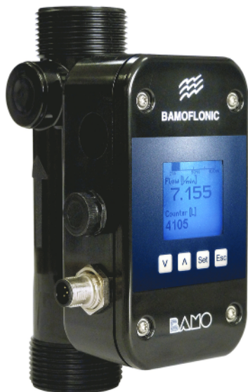
Modelo PPSU (DN10 a DN25)