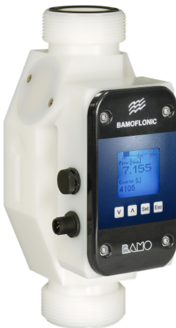
Modelo PE-HD (DN32 a DN50)